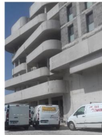
Projet GRANDOLA à Tarnos.

16 387 heures ont été intégrées à des nouveaux marchés